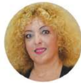
ΤΕΡΗ ΣΩΤΗΡΙΑ Ιδιωτική Υπάλληλος