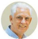
ΦΩΤΙΟΥ ΣΤΑΥΡΟΣ π. Δήμαρχος Νέας Περάμου